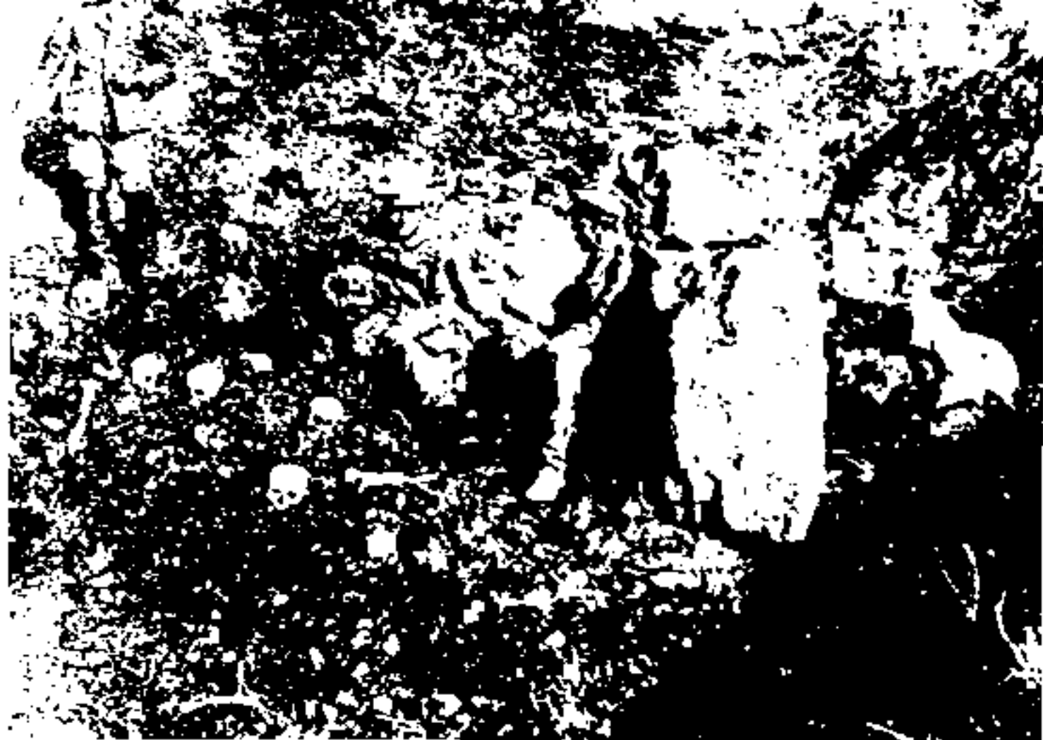
قتل عام طرابلس