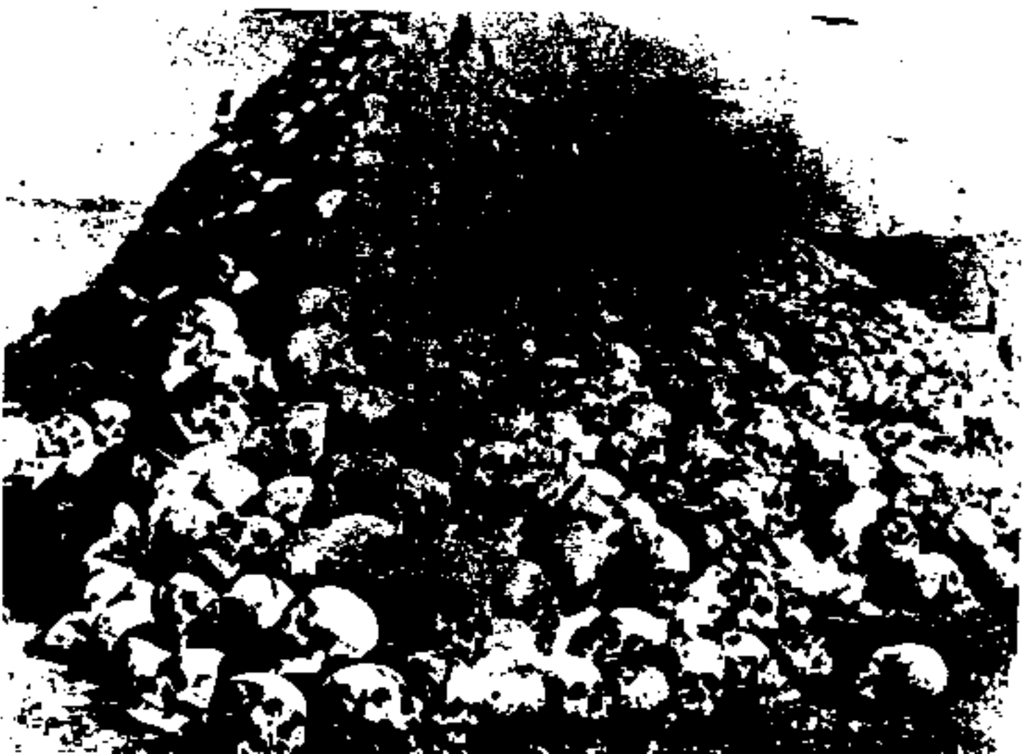
سرهای 'راسته‌ای' که قتل عام شدت در سال ۱۹۱۶