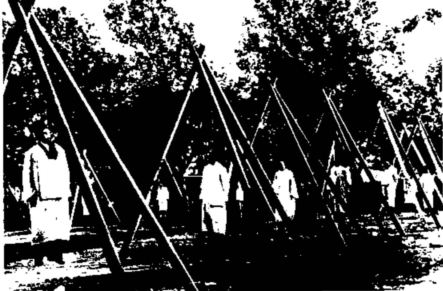
سراي حزب داتشاك در بالای چوبه های دار در اسلامبول.