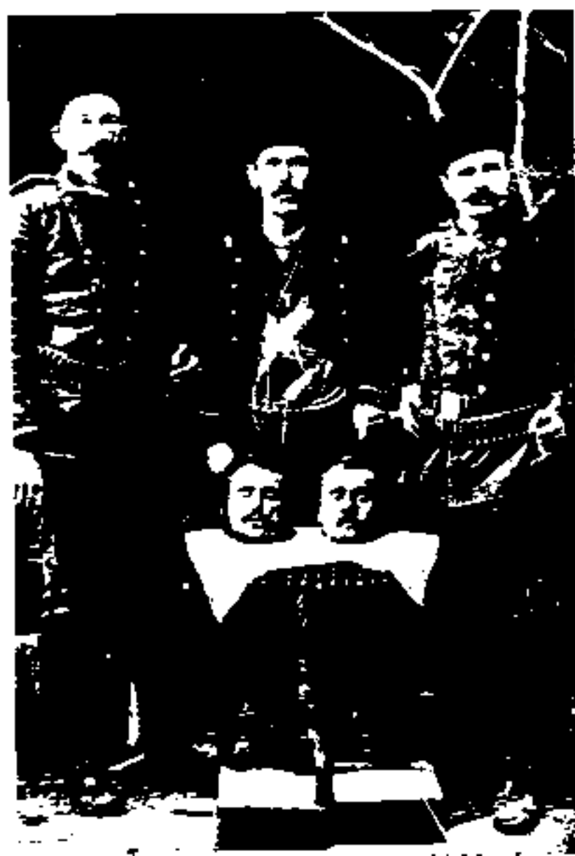
سرهای بریده دو ارمنی عضو خانیقاه دولت عثمانی.